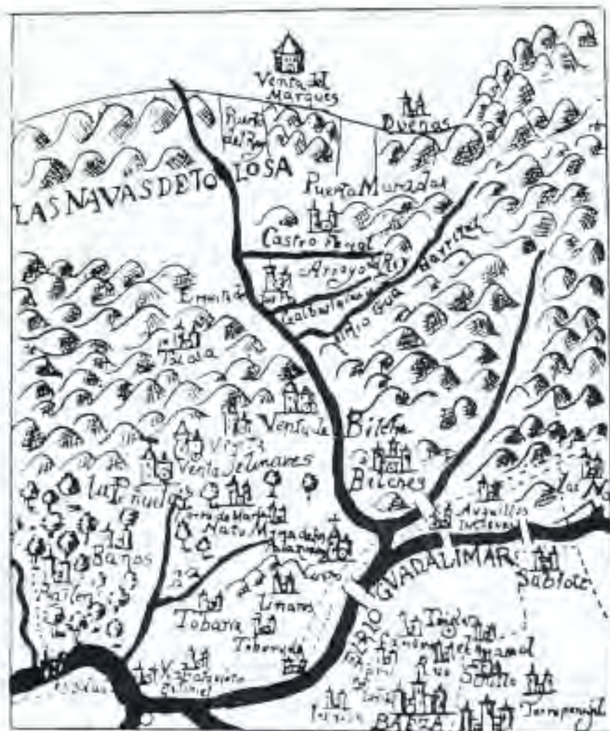
El campo de batalla es un campo del siglo XVI.

ta de Zaragoza por Alfonso el Batallador, y en vano fue que los monarcas españoles se esforzaran para detenerlos: nada bastó a hacerles variar de resolución, y todos ellos abandonaron la cruzada, menos Arnaldo, arzobispo de Narbona, y Teobaldo Blascón de Poitiers, español de nacimiento.