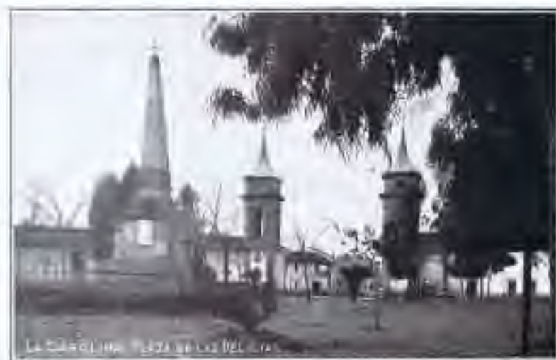
Posible lugar de cruce de CALZADAS ROMANAS

No hay que olvidar que el nombre de Tolosa sugiere una relación con los restantes lugares de España de esta denominación y, sobre todo, con la Monarquía Visigoda, que