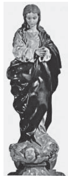
Inmaculada de Alonso Cano

Como apunte, para ilustrar esta exposición podemos decir, que las cuatro imágenes que traemos de las iglesias de Andalucía datan del siglo XVIII, igual que la desaparecida de Fuente Palmera, son bellas esculturas entre las que destacaremos a la de La Carlota por ser de mayor tamaño, aunque más pequeña que al natural, inspirada en la cieguesita de Martínez Montañez, se diferencia en la mirada que la tiene al frente y el manto lo tiene recogido en ambos hombros, San Sebastián tiene dos bellísimas imágenes, de tamaño menor que nos recuerdan a la de Alonso Cano, la patrona que preside el altar mayor, que fue restaurada cuando se construyó la nueva iglesia, no con mucho acierto pues la túnica aparece actualmente de tono