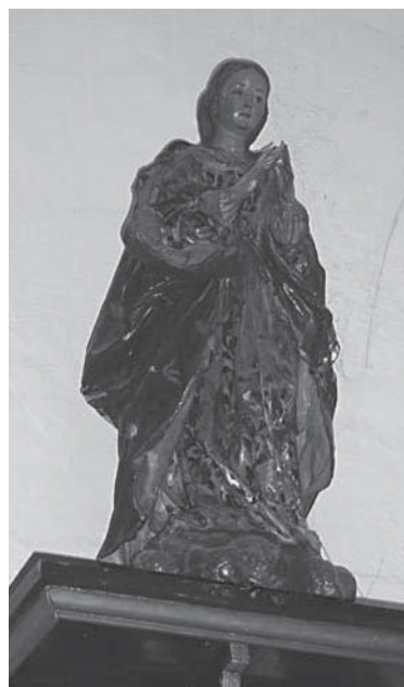
Purísima de Fuencubierta

FUENCUBIERTA. Es una imagen de claro aspecto rococó, posiblemente de un taller madrileño, tal vez del último cuarto del siglo XVIII.