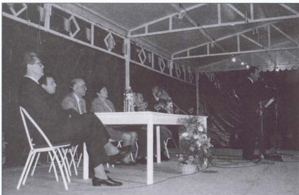
El alcalde de Fuente Palmera clausura el Congreso.