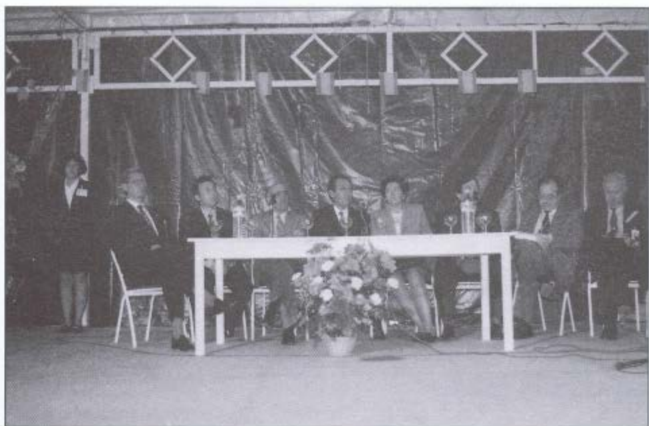
Mesa presidencial de la clausura del Congreso en Fuente Palmera.