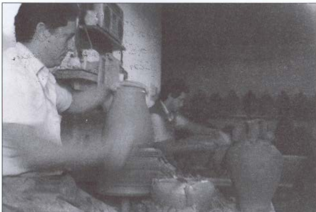
Visita a los Alfares Rambleños.