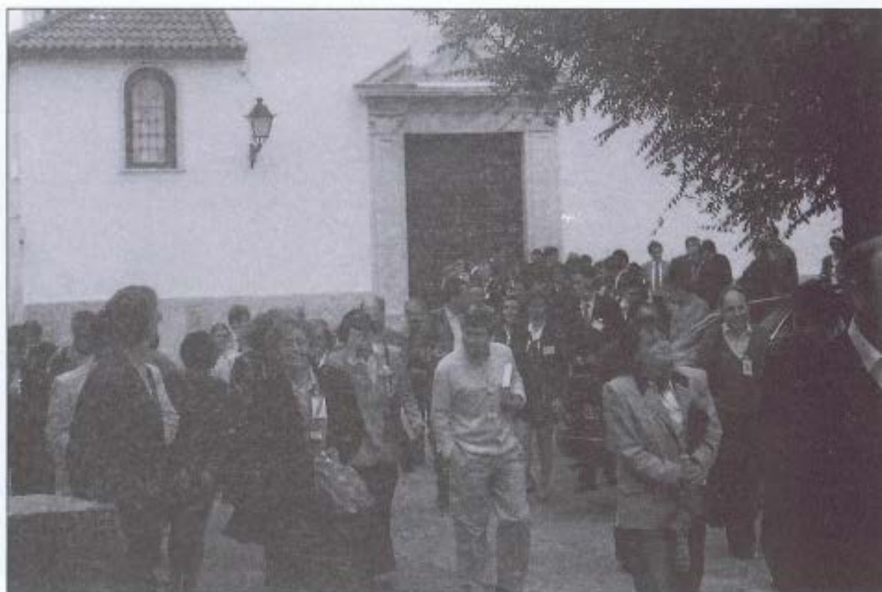
Salida visita parroquia de San Sebastián de los Ballesteros.