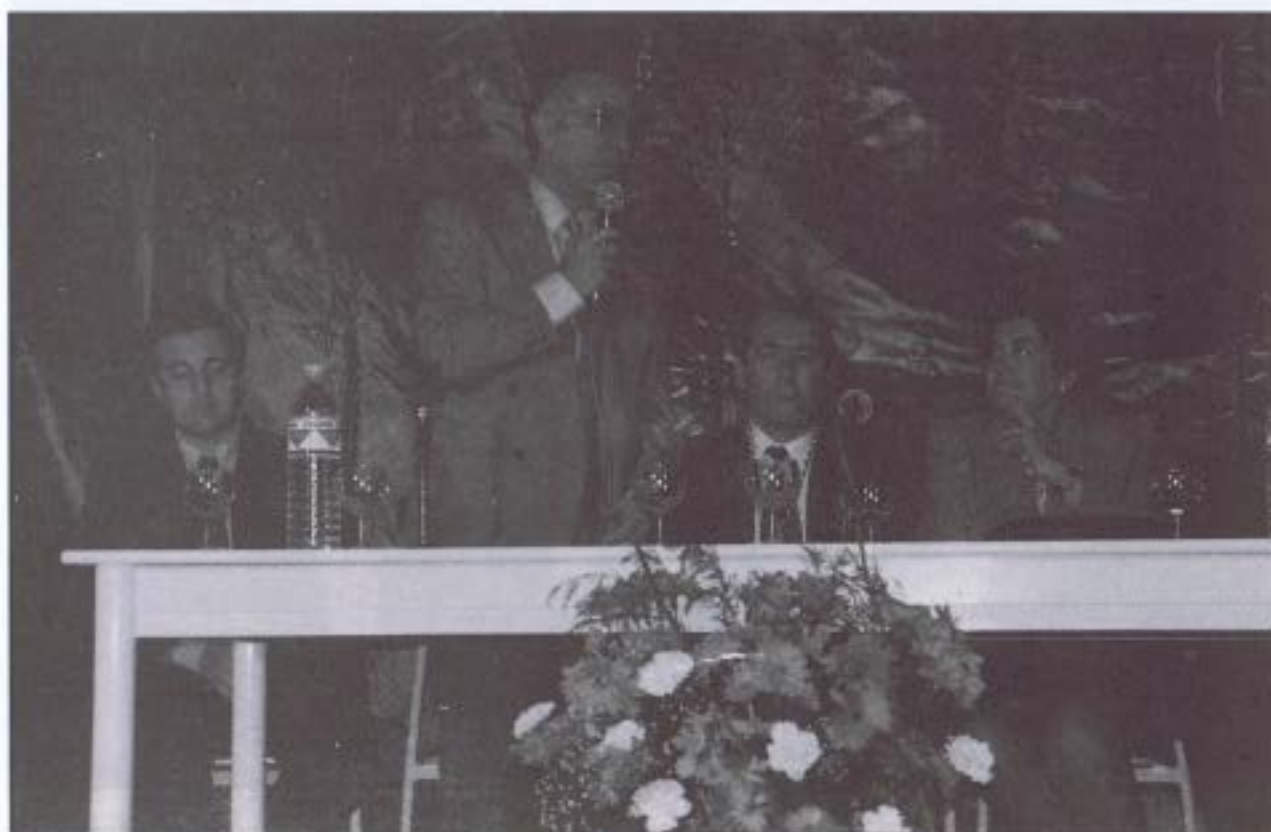
Palabras del Presidente de la Diputación Provincial de Córdoba en la clausura.