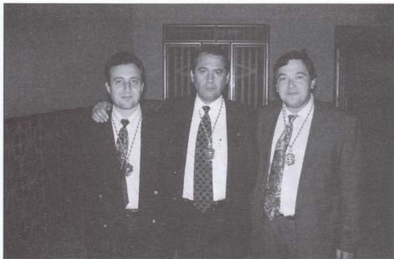
Alcaldes de los tres pueblos organizadores luciendo sus medallas de Colono de Honor.