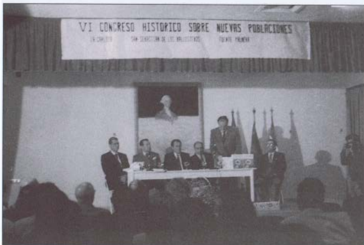
Clausura del VI Congreso. Fuente Palmera.