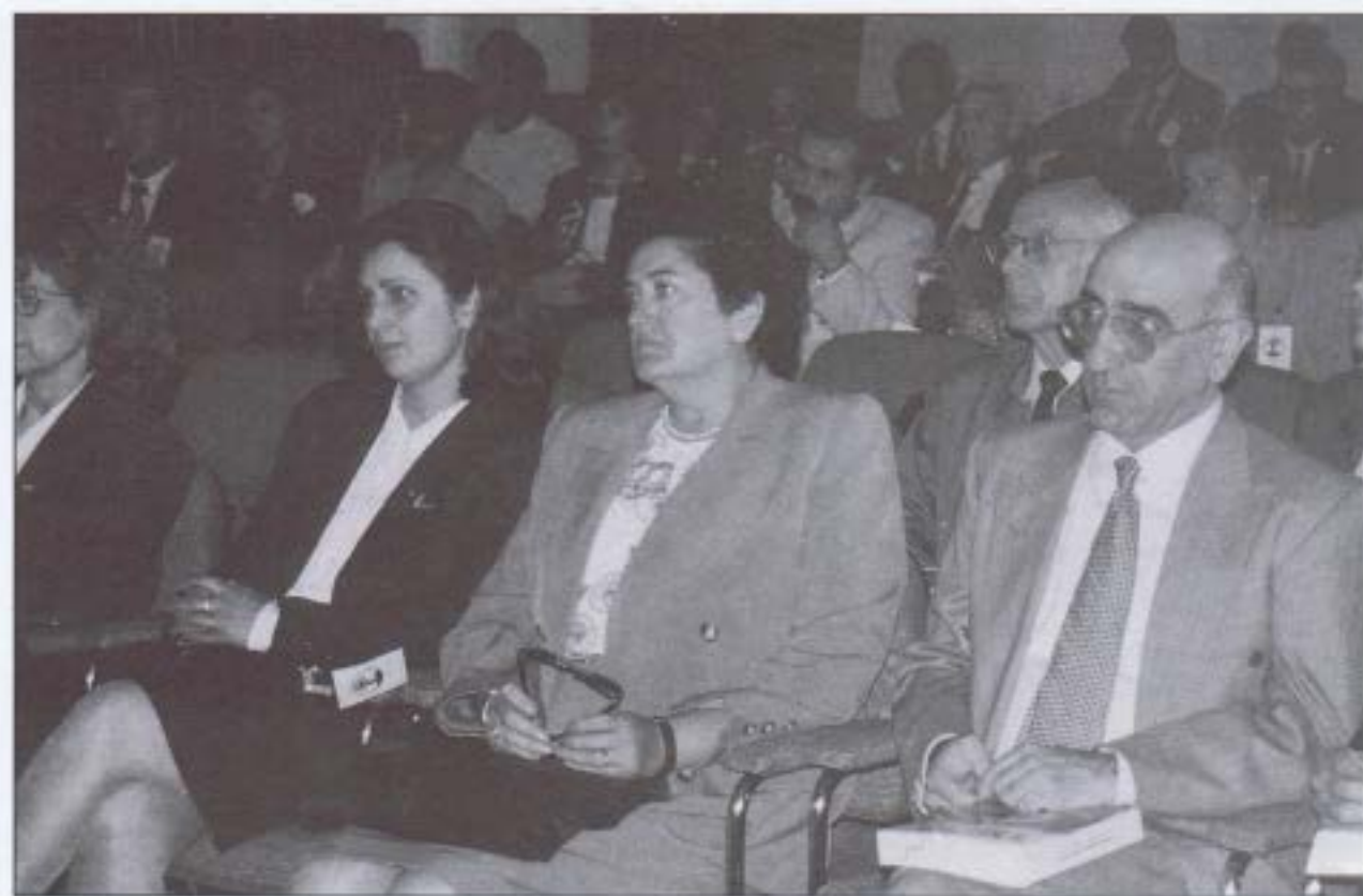
Autoridades y público asistentes a las sesiones del Congreso.