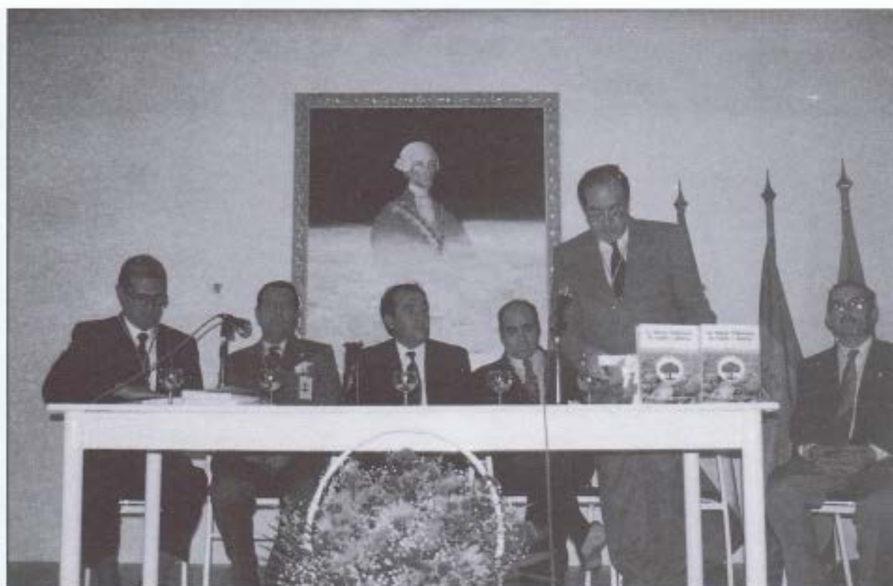
Acto de presentación de las Actas del V Congreso Histórico sobre Nuevas Poblaciones.