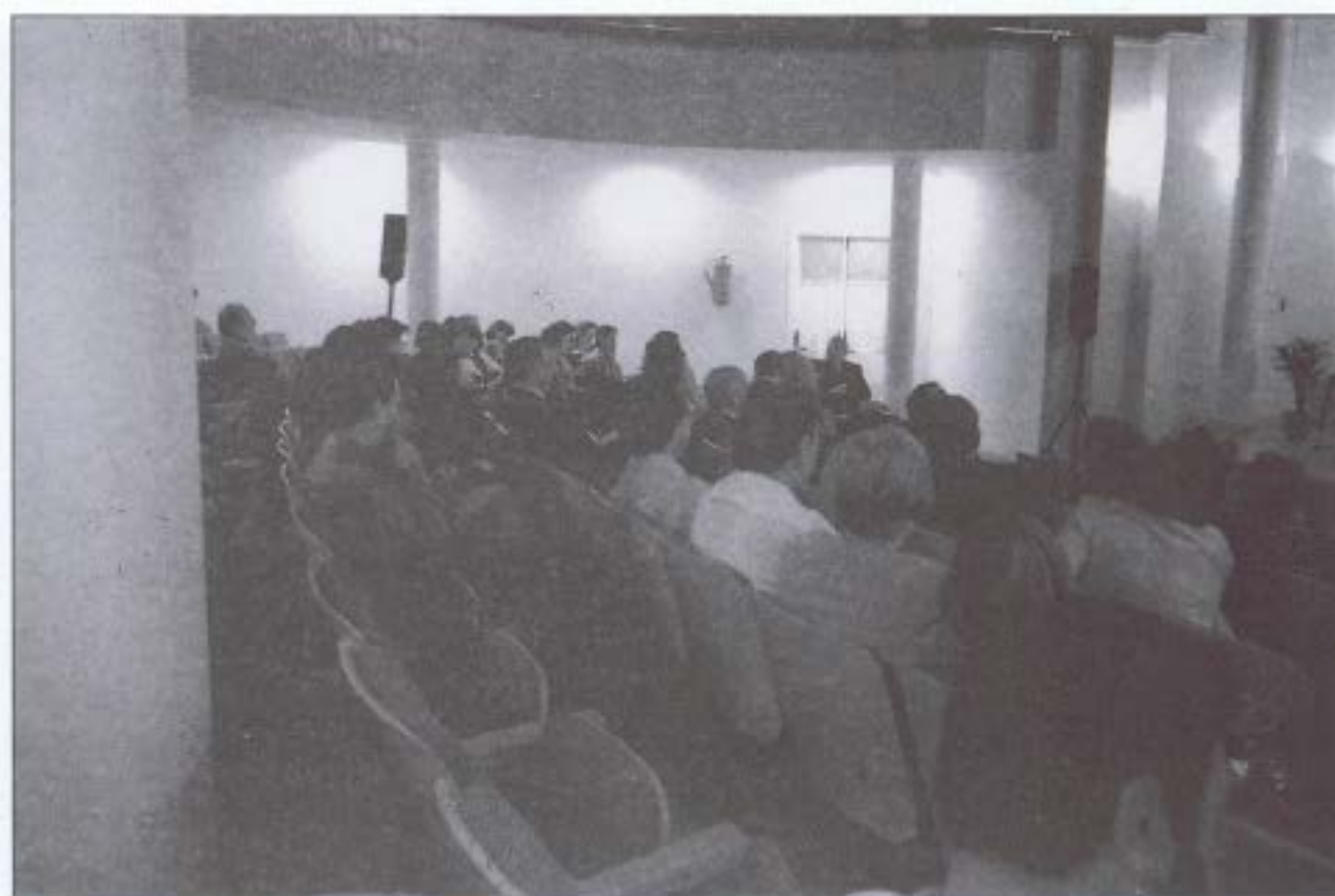
Aspecto que presentaba el Salón de Actos del Ayuntamiento de La Carlota durante las jornadas.