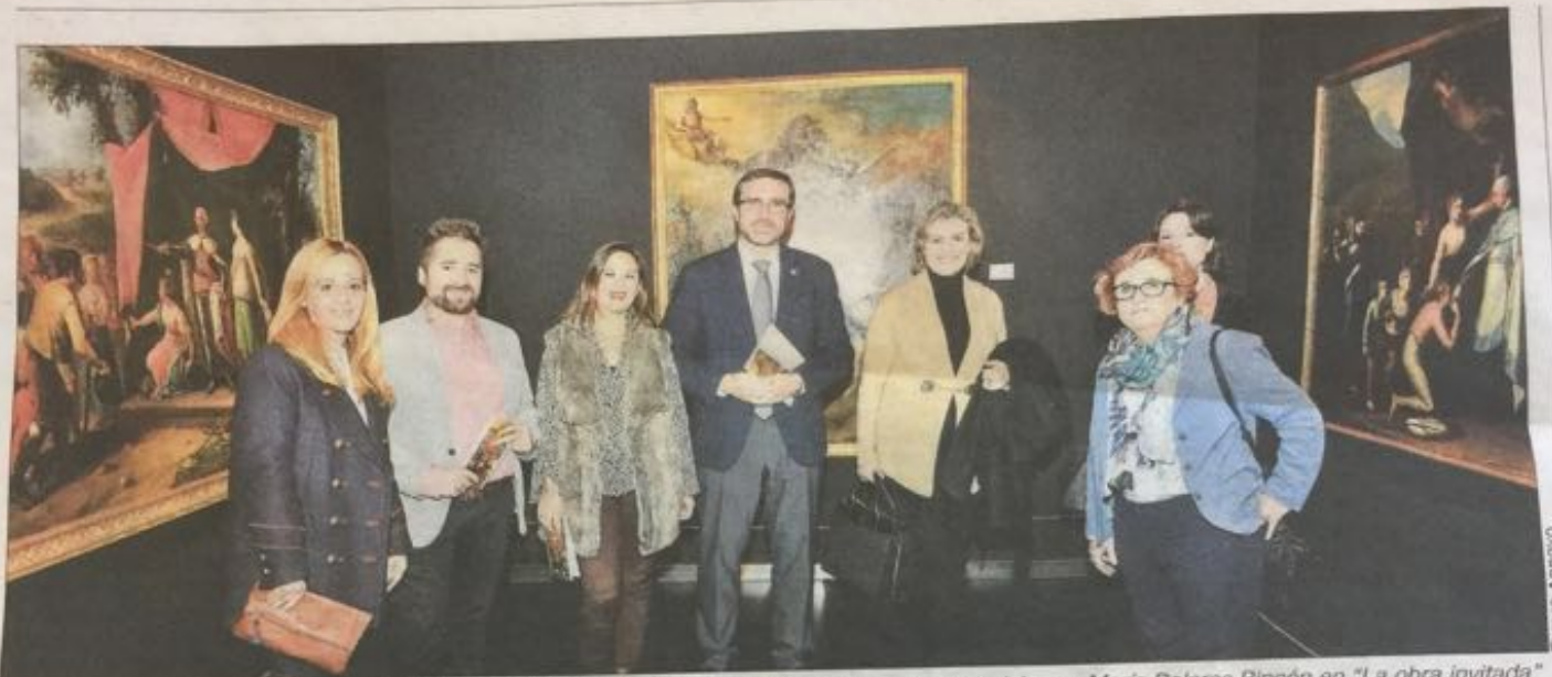
PREN Co co la de E. P — cor gén cel su pr na te ga pi er m n P I c I J s c