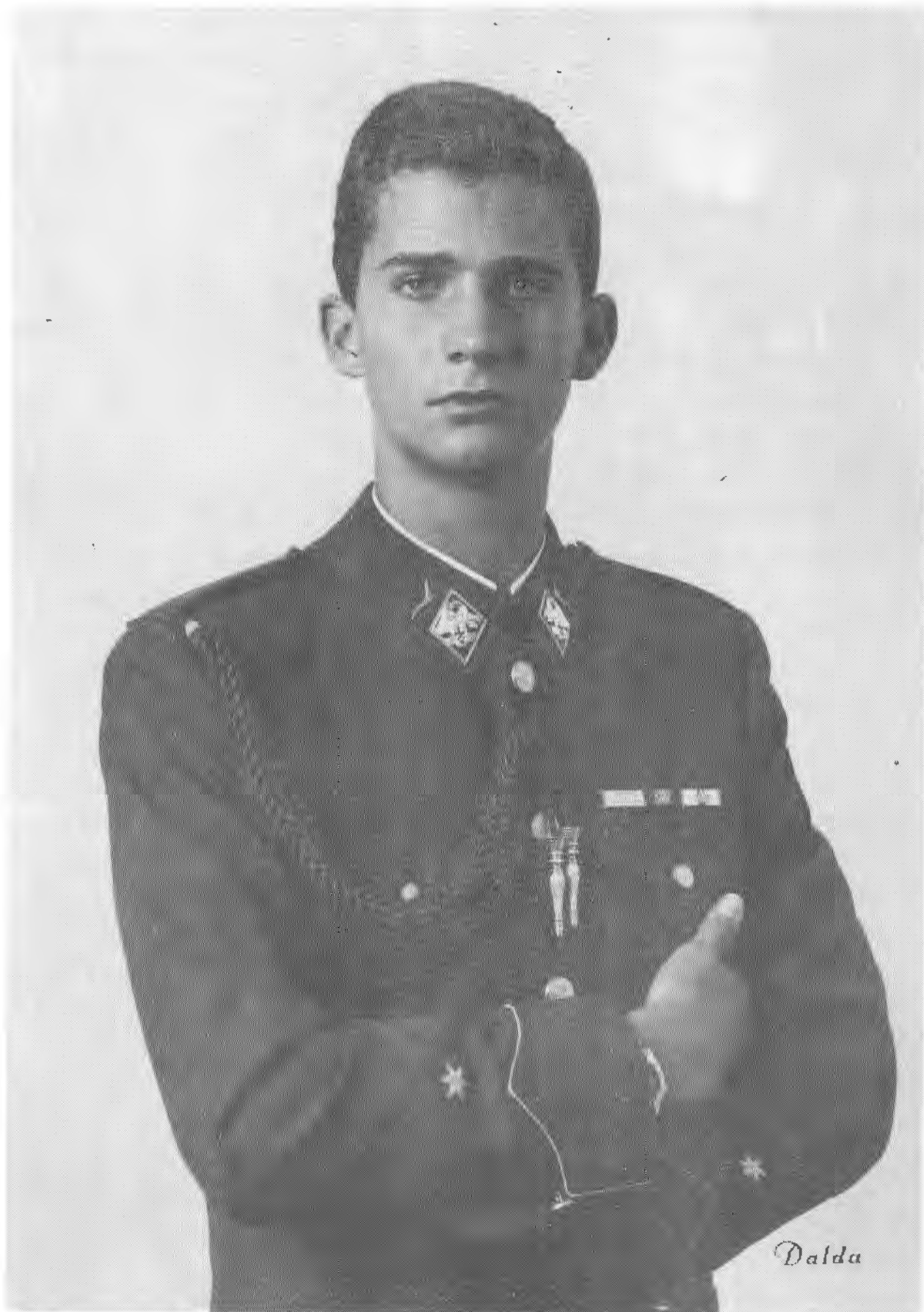
S.A.R. D. FELIPE DE BORBON Y GRECIA PRINCIPE DE ASTURIAS PRESIDENTE DE HONOR DEL CONGRESO