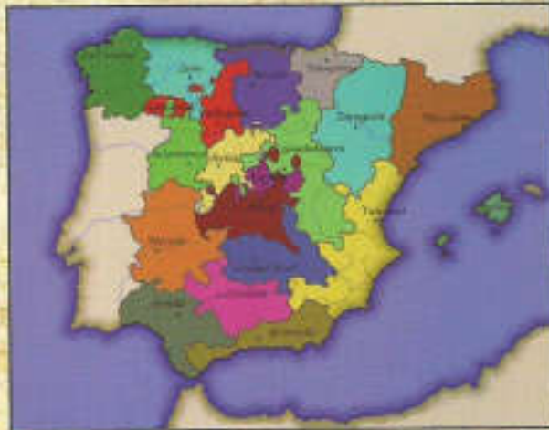
Intendencias de Felipe V

1720, el primer Borbón, Felipe V, ordenará la creación de las intendencias, que sumarían un total de 20 (La Coruña, León, Valladolid, Burgos, Pamplona, Zaragoza, Barcelona, Salamanca, Ávila, Guadalajara, Toledo, Madrid, Ciudad Real, Valencia, Mérida, Sevilla, Córdoba, Granada, Palma y Santa Cruz de Tenerife), pero que no coincidían demasiado con los viejos territorios de las ciudades con derecho a voto en cortes precedentes.