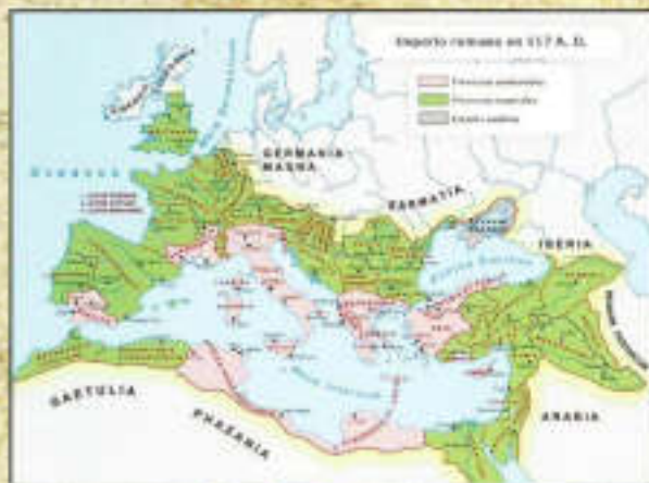
Provincias del Imperio Romano

términos: pro ("por") y vincia ("victoria"); esto es... "por victoria".