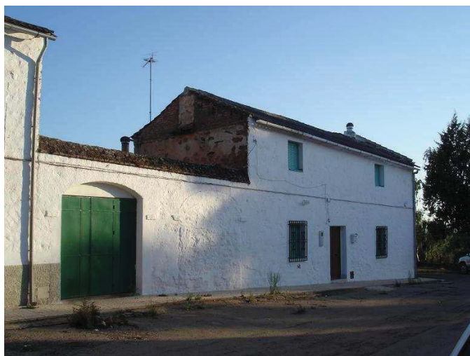
Casa de colonos de la aldea de El Acebuchar con puerta delantera para entrar al corral.