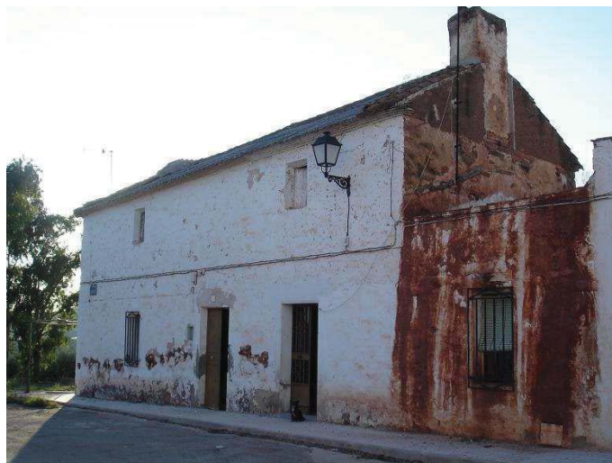
Casa de colonos de la aldea de El Acebuchar con puerta delantera para entrar al corral convertida en una ventana. Foto: F. J. Pérez Fernández, 2010.