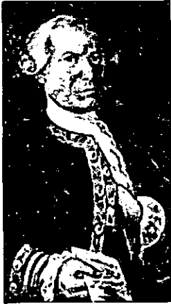
Retrato de Juan Gaspar de Thürriegel

Condición que no siempre se cumplió porque ni Thürriegel ni sus enganchadores se preocuparon de hacerlo, por sus prisas en realizar la totalidad de la contrata.