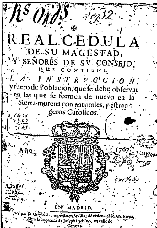
Portada de la Real Cédula.

“SABED, que habiéndome propuesto Don Juan Gaspar de Thurriegel, de nación bávaro, de Religión Católica, la introducción de seis mil colonos católicos alemanes y flamencos en mis dominios, tuve a bien admitir esta propuesta baxo de diferentes declaraciones, que reducidas a contrata se expresan por menor en mi Real Cédula”. 1