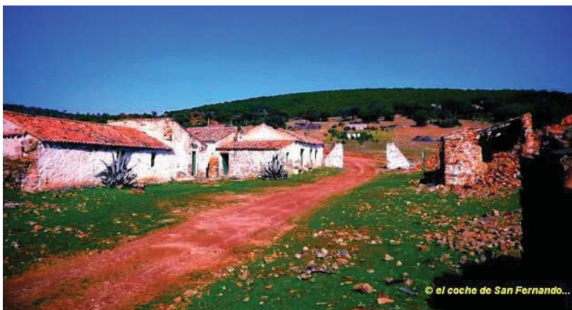
La aldea de Magaña (Santa Elena). En la actualidad es una cortijada abandonada. Foto: Mariano Andújar, 2013. Fuente: http://elcochedesanfernando.blogspot.com.es/ .